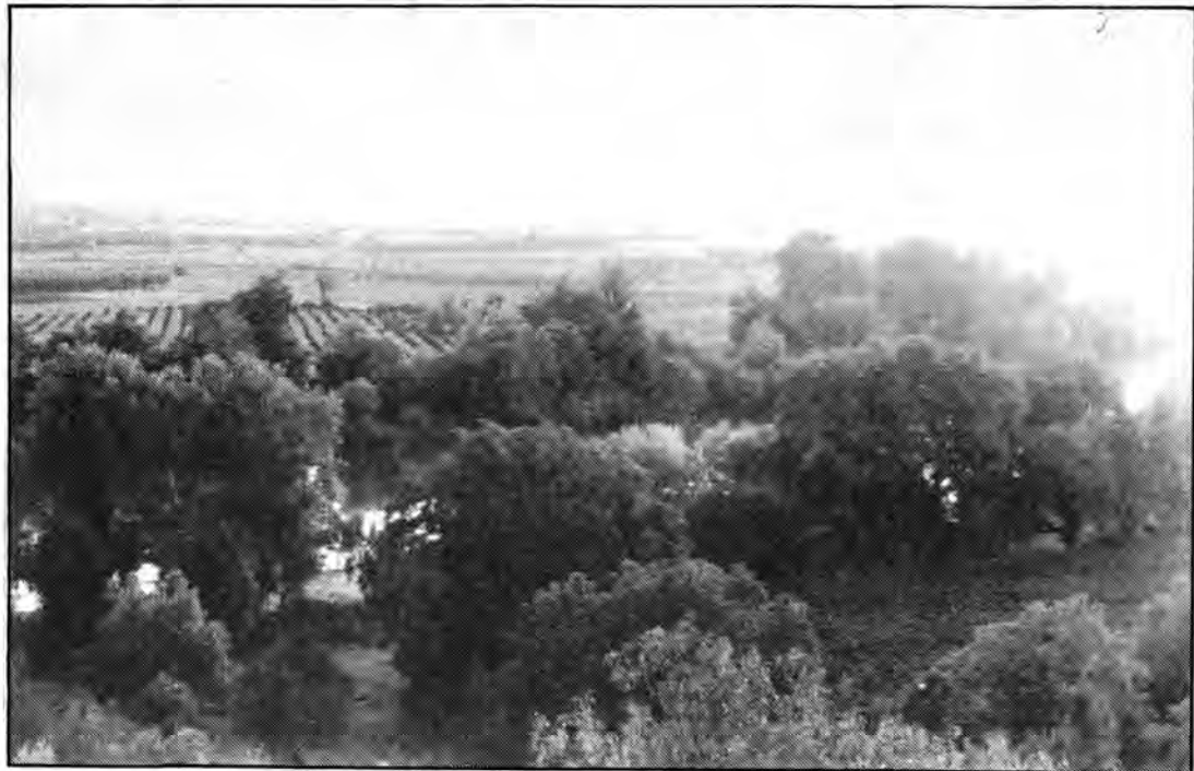
Άποψη από τον Λεσινιώτικο Κάμπο.

του. Έτσι δημιουργήθηκε ένα απέραντο σύγχρονο περιβάλλον. Ήδη το βαμβάκι και το σιτάρι άρχισαν να αποδίδουν.