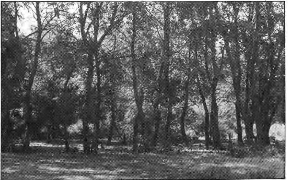
Άποψη του δάσους του Φραξιά

6. Με βάση την ονοματολογία των Τσοούνη - Χανδρινού στο δάσος