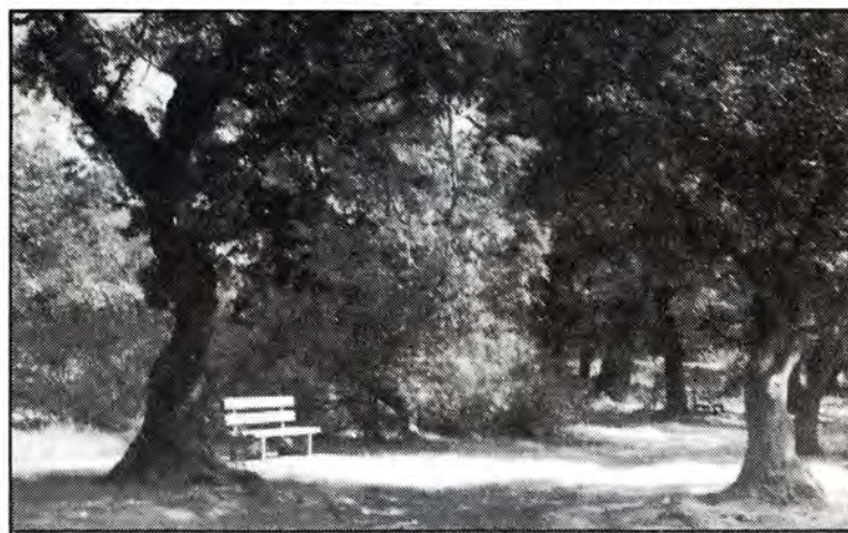
Χώρος αναψυχής στον Φραξιά

απ' αυτά έχουν εκχερσωθεί είτε για καλλιέργεια είτε για ξυλευση είτε από φωτιές.