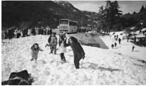
Εκδρομή στα Καλάβρυτα

Τον Νοέμβριο του 2004 μετά από πολλές προσπάθειες και αφού πριν μας πέρασε από το μυαλό να τα παρατήσουμε, αφού δεν υπήρχε συμμετοχή - οργανώσαμε το σύλλογό μας με πίσμα και θέληση να αλλάξουν κάποια θέματα γύρω από το σχολικό περιβάλλον.