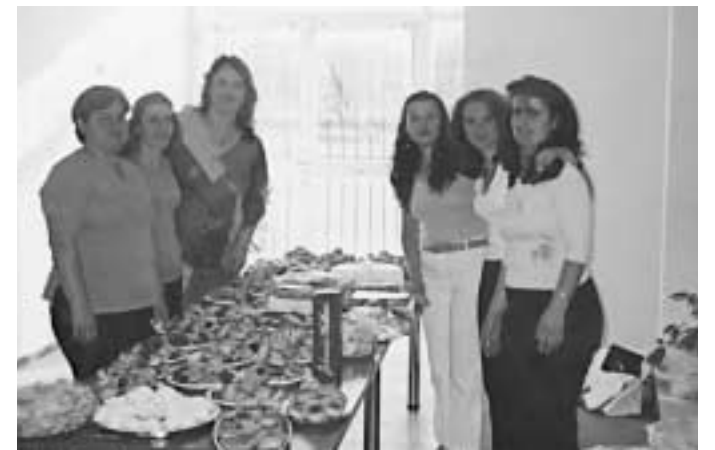
Τα μέλη του δραστήριου Διοικητικού Συμβουλίου

Άξιο επαίνων και συγχαρητηρίων είναι το Διοικητικό Συμβούλιο του Συλλόγου Γονέων και κηδεμόνων του Δημοτικού Σχολείου του χωριού μας.