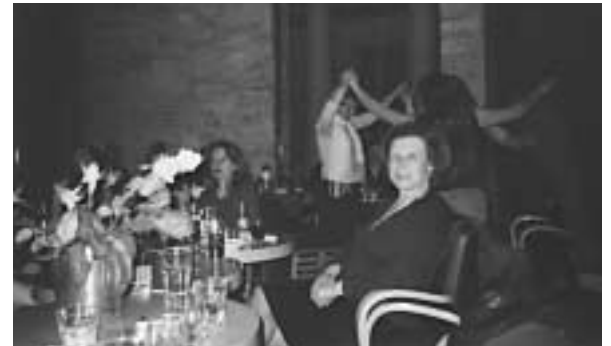
Χορός γυναικών 2006