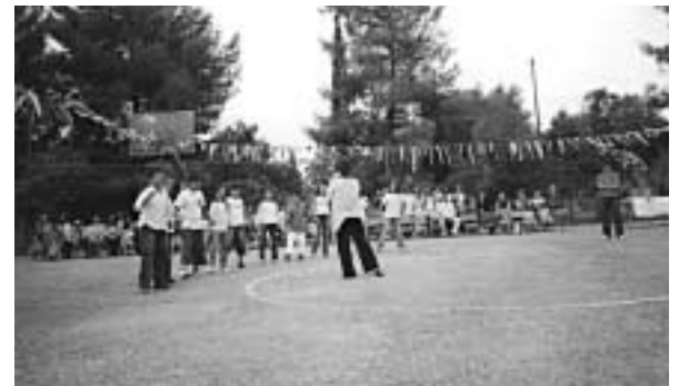
Χοροί από τη γιορτή 2005