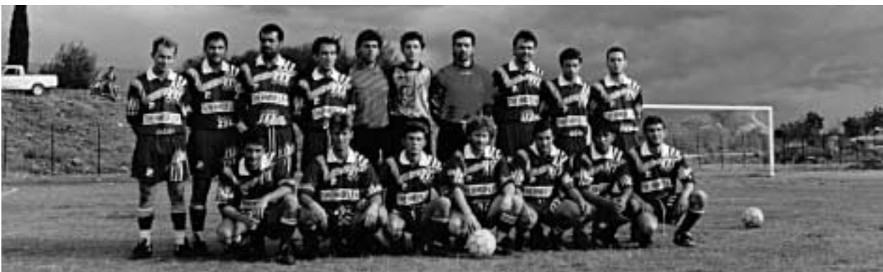
Παλαιότερη φωτογραφία του Α.Ο. Πενταλόφου

Έμφυχο υλικό υπάρχει και μάλιστα αξιόλογο. Οι ποδοσφαιριστές που θα σηκώσουν το βάρος στον αγωνιστικό τομέα είναι οι παρακάτω (σειρά αλφαβητική):