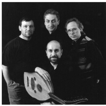
το κουαρτέτο «Night Ark»